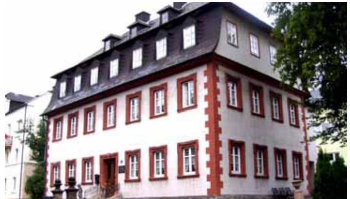
Blick auf das „Alexander v. Humboldt Haus“ in der Badstraße

Steben wird in das Netz der Postanstalten einbezogen, indem es eine Hilfestelle („Postexpedition“) erhält. Der Ort hat rund 900 Einwohner.