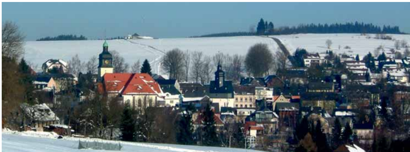
Bad Steben im Winter

info@klinik-am-park.eu www.klinik-am-park.eu