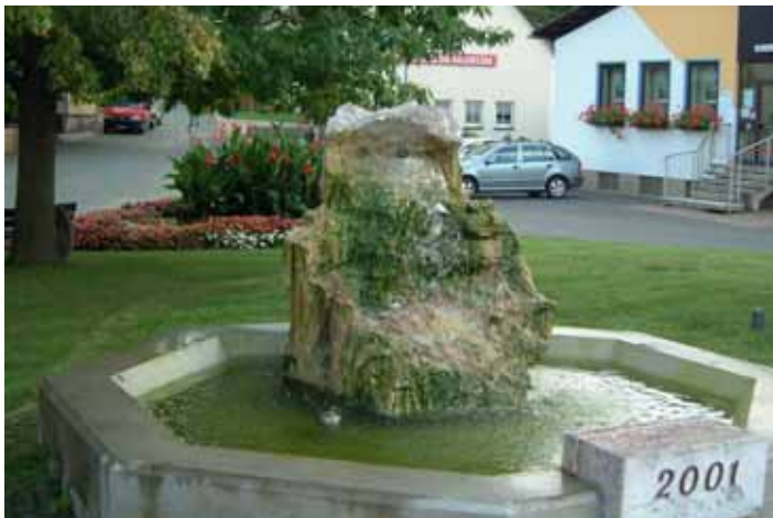
Der „Raiffeisenplatz“ im Ortsteil Bobengrün

Klinikum Hof Eppenreuther Straße 9, 95032 Hof Tel. 0 92 81/98-0