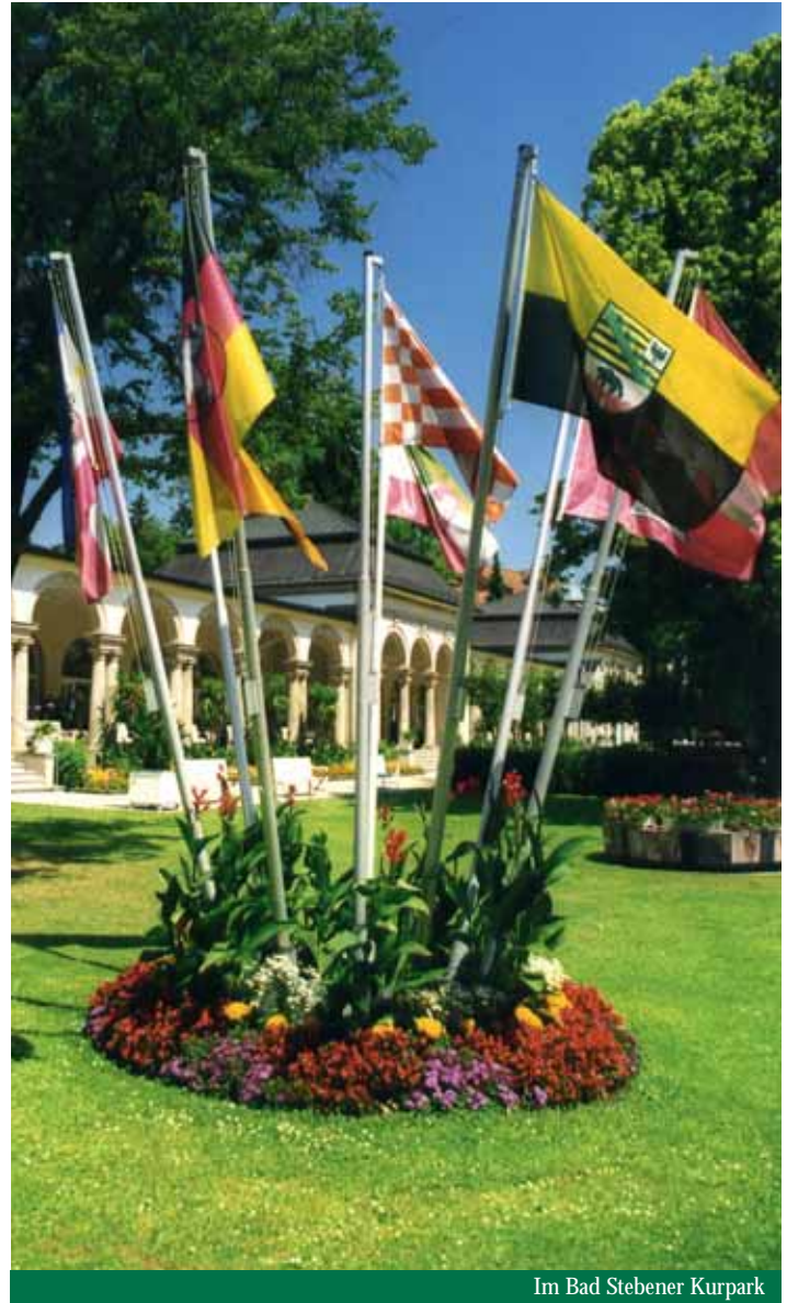
Im Bad Stebener Kurpark