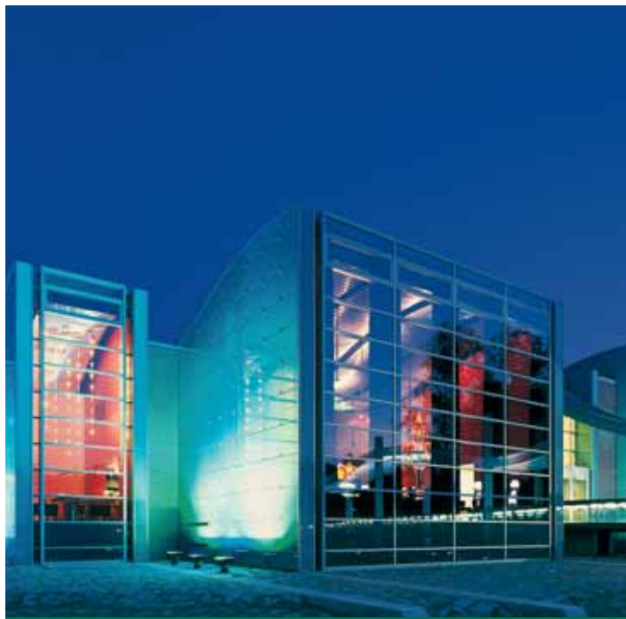
Bayerische Spielbank Bad Steben

Seit 23. März 2001 ist das Bayerische Staatsbad Bad Steben um eine weitere Attraktion reicher: die Spielbank. Als letzte der vier neuen bayerischen Spielbanken (nach Bad Füssing, Kötzing und Feuchtwangen) erhöhte die Spielbank Bad Steben die Anzahl der Casinos im Freistaat auf neun. Planer der Spielbank ist Professor Meinhard von Gerkan aus Hamburg, der zu den besten Architekten der Welt gezählt wird.